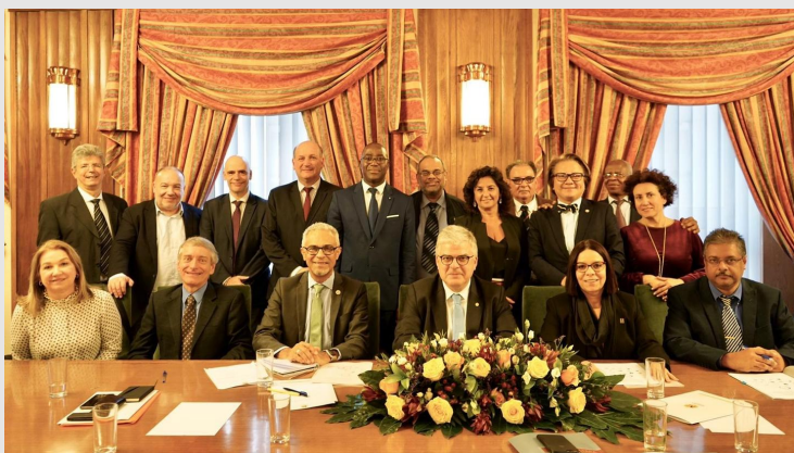
1.ª Reunião da CODEM-LP

Num espaço cada vez mais global, dinamizar a internacionalização e as relações externas (OE3) é um dos objetivos estratégicos traçados pela FMUL. Para tal, durante o ano de 2019, a Faculdade procurou aprofundar o seu compromisso com os seus parceiros, nomeadamente com a ULisboa, o CHULN, o IMM, a AIDFM, a AEFML, a AAAFML e a CPMUL, sendo ainda de destacar: